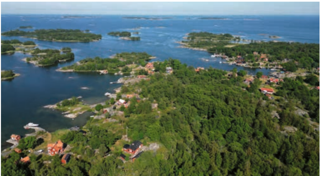
Luftaufnahme von Rödlöga Byfladen.

Am Ufer von Megelskär gibt es eine Abpumpstation am Steg.