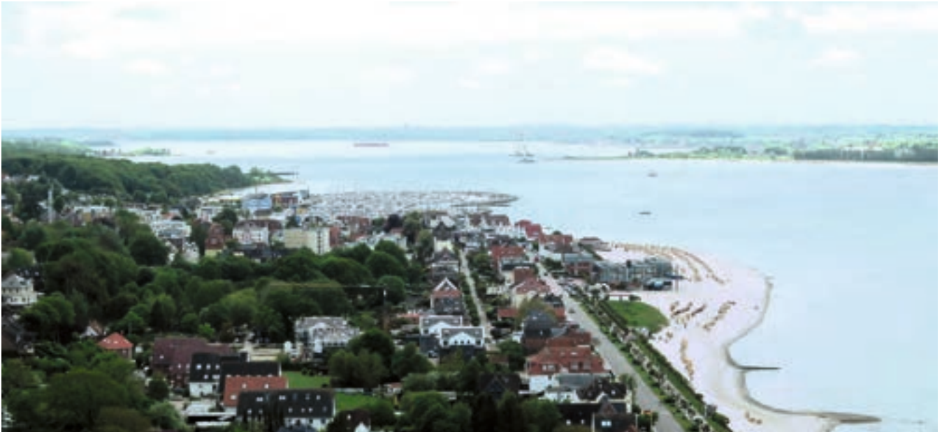
Blick von Laboe nach Süden über die Kieler Förde. Die Marina Baltic Bay in Laboe ist sichtbar.