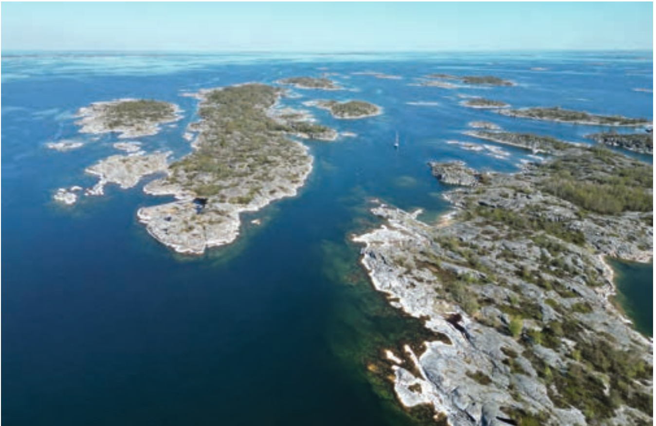
Luftbild des Ankerplatzes Grubben bei Stora Nassa.

Die Passage zwischen Bäckskäret und Jungfruskäret nach Nordosten in den Jungfrusundet ist deutlich zu erkennen.