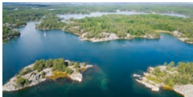
Die wunderschöne Blå Kusten (Blaue Küste) in Ostschweden.