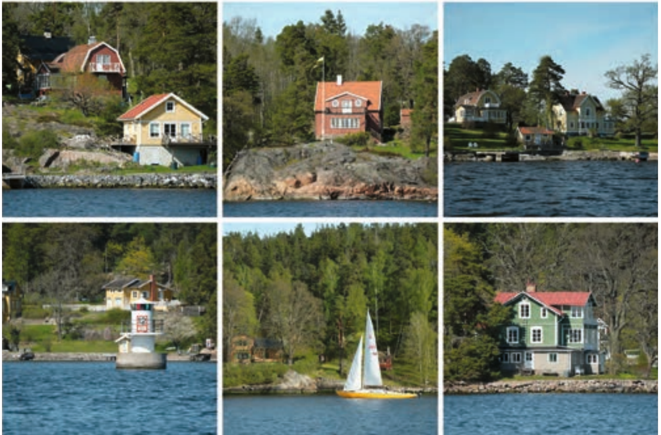
Die Häuser im Schärengarten sind oft Zweitwohnsitze und alle sind tadellos gepflegt.

Ein weiteres Gefahrenpotenzial geht von den großen modernen Fähren und Kreuzfahrtschiffen aus, die durch die gewundenen Passagen der inneren Zufahrten nach Stockholm unterwegs sein können. Manchmal kann man nur die oberen Decks einer Fähre hinter einer nahe gelegenen Insel sehen, die wie ein sich bewegender Wohnblock erscheinen. Es kann nicht oft genug betont werden, dass diese Fähren zu jeder Zeit absolute Vorfahrt haben. Einige der Durchfahrten sind so eng, dass eine Fähre nicht einmal eine kleine Yacht dort passieren könnte und die großen Geschwindigkeitsunterschiede