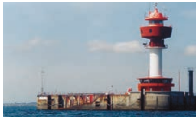
Der Leuchtturm Kiel markiert die Zufahrt zum Hafen. A. und A. Fleck

Wenn Schießübungen stattfinden, wird an Türmen an der Küste bei 54°26'N 10°19'E und 54°23'N 10°56'E sowie an allen anderen dazwischen liegenden Standorten ein Feuer