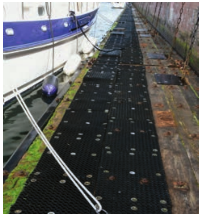
Die neuen Schleusen in Holtenau. Beachten Sie die sehr niedrigen schwimmenden Holzpontons und die horizontalen Fender.

Die Schleusenwärter geben auch Anweisungen an Sportboote über Lautsprecher. Sie sind jedoch sehr beschäftigt, also vermeiden Sie es nach Möglichkeit, sie durch unwichtige Anrufe zu stören. Bei plötzlichem Nebel oder schlechter Sicht können Boote vorübergehend festmachen. Sportboote